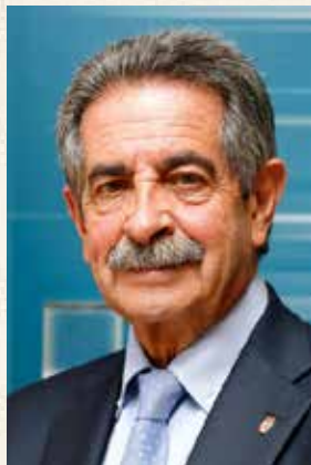
Miguel Angel Revilla Presidente de Cantabria